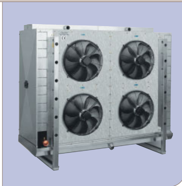
AlfaBlast ABE 502 A7 с водяной системой оттаивания.

Каркас, изготовленный из нержавеющей стали или алюминия, специальные вентиляторы для создания высокого статического давления, разнообразные системы оттаивания (вода, электричество, горячий газ) и защитное покрытие змеевика (катафорезное, термо-защита, эпоксидное покрытие), а также предварительно покрытие ребер.